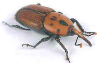
Rhynchophorus ferrugineus (Escaravelho vermelho ou escaravelho da palmeira)