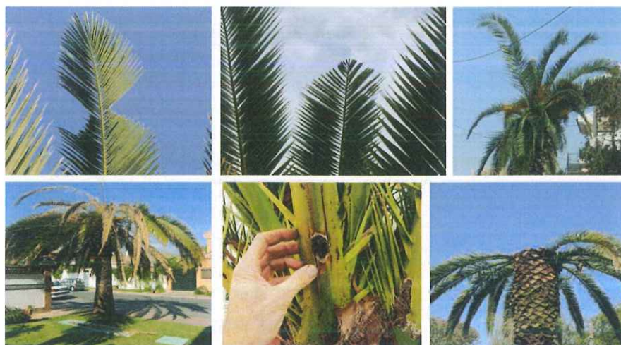
Sinais evidentes da existência da praga

Realização de tratamentos fitossanitários com os produtos fitofarmacêuticos homologados pela Direção Geral de Alimentação e Veterinária.